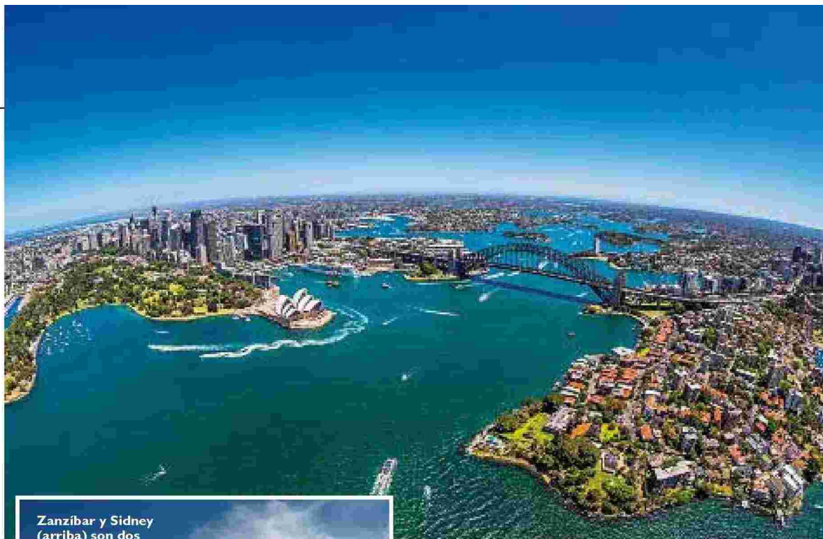
Zanzíbar y Sidney (arriba) son dos de los destinos de Qatar Airways.